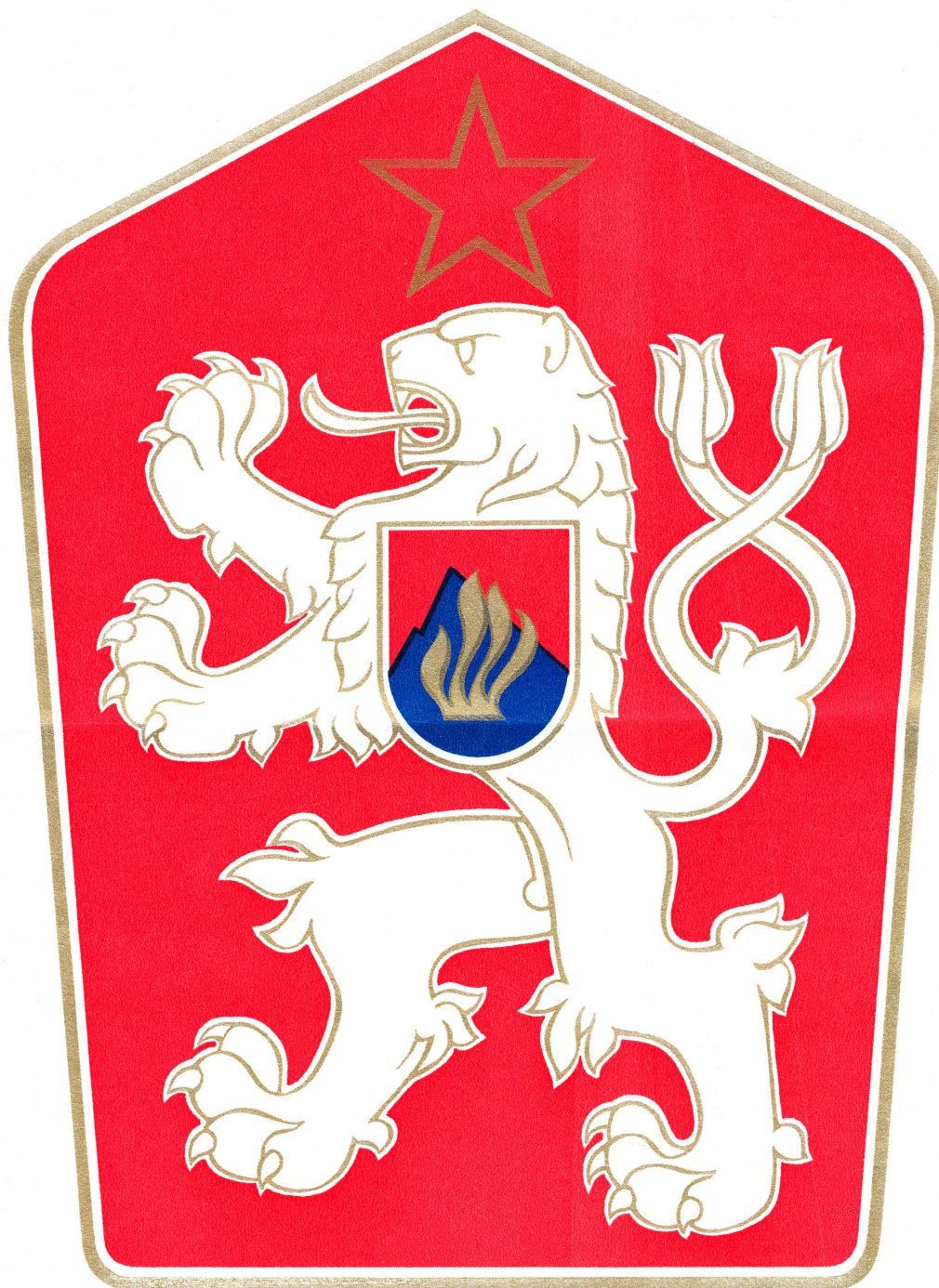
ŠTÁTNY ZNAK ČSSR