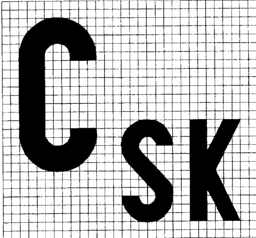
Slovenská značka zhody určených výrobkov