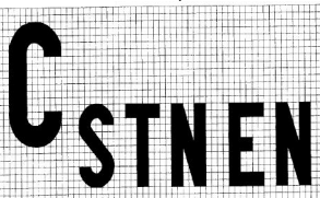
Značka zhody s európskou normou prevzatou do sústavy slovenských technických noriem