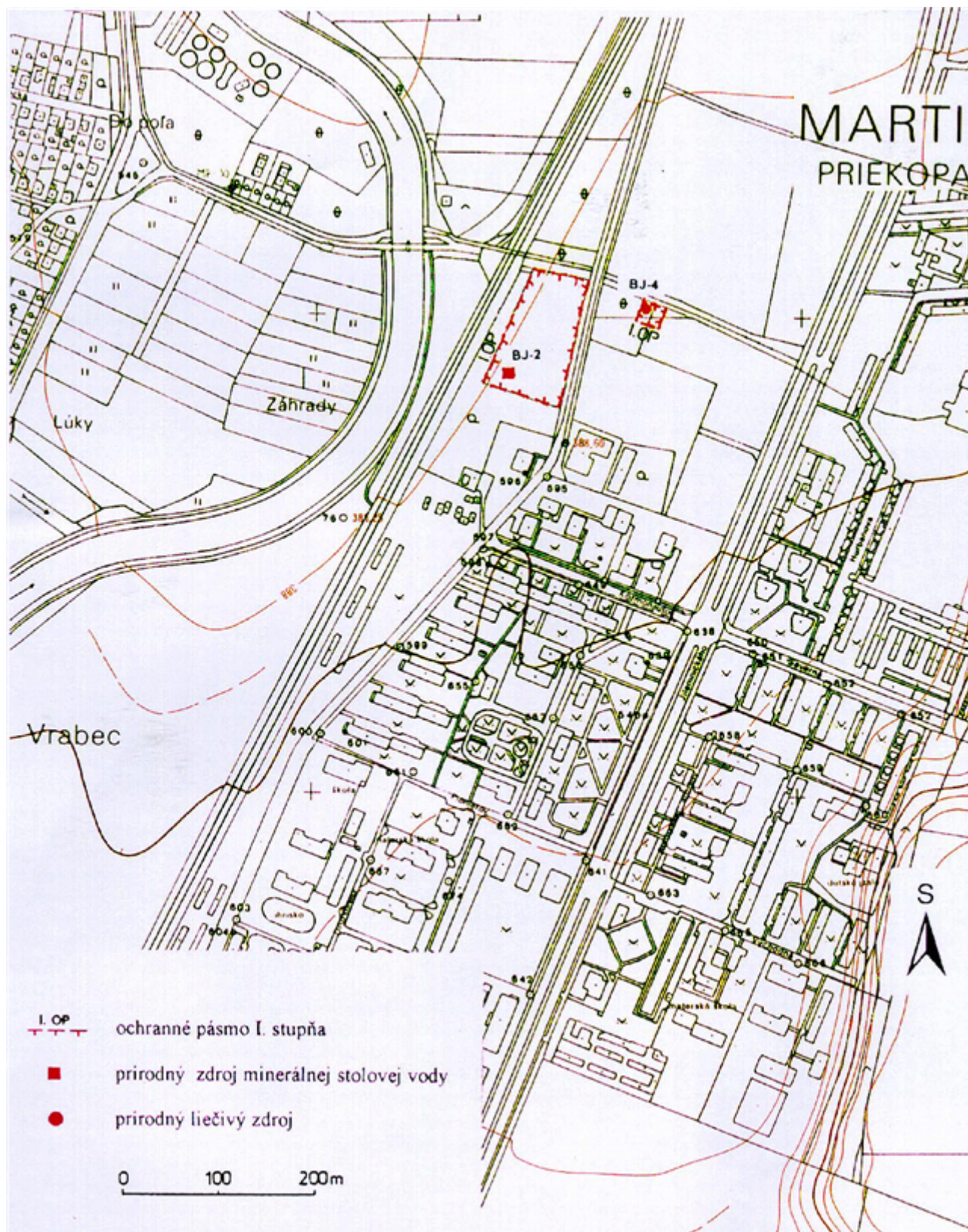
Príloha č. 2 k vyhláske č. 20/2000 Z. z.