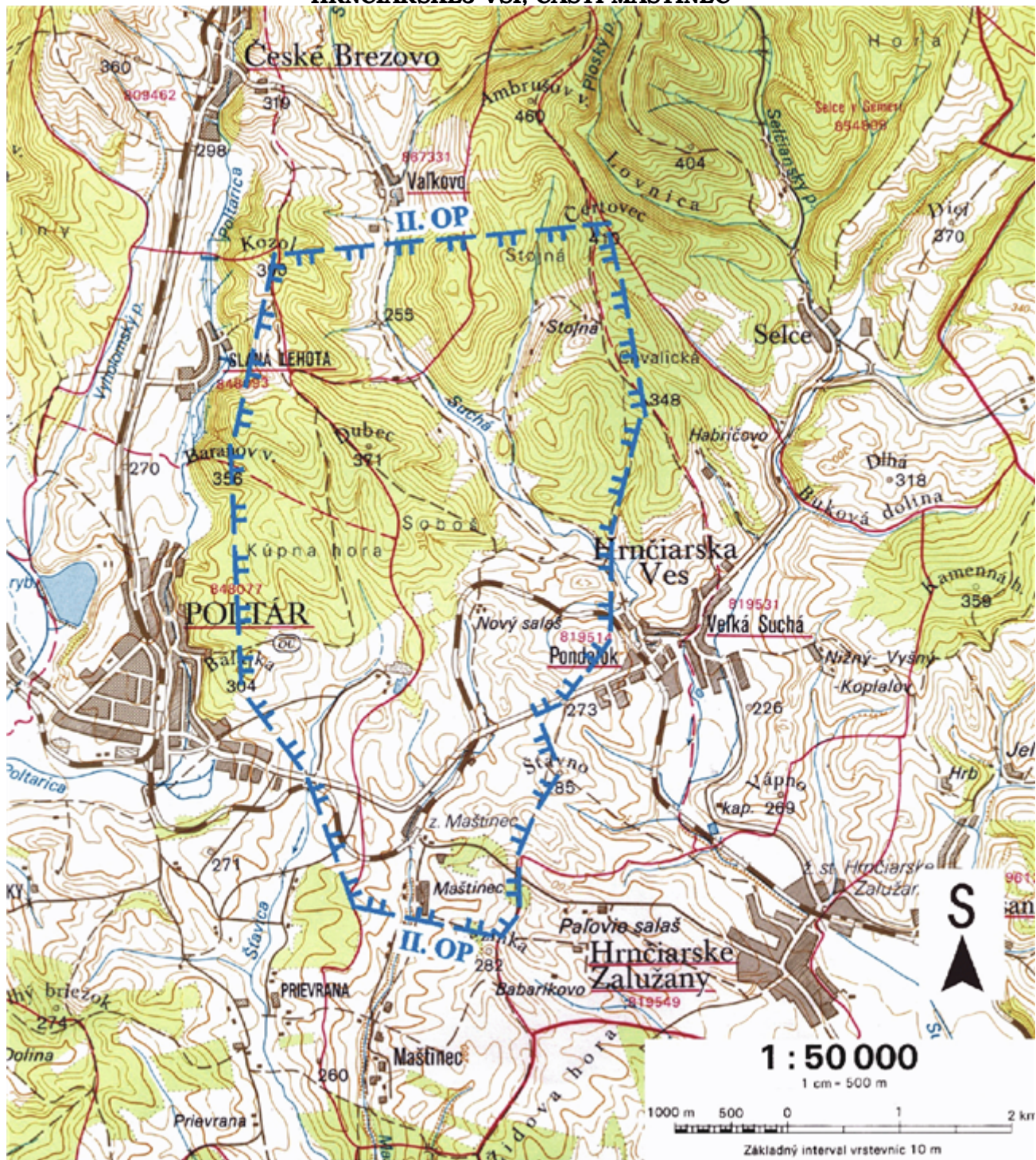
II. OP ochranné pásmo II. stupňa