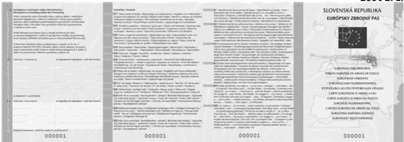
- vonkajšia strana