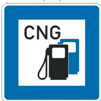
D 22c Čerpacia stanica stlačeného prírodného plynu (CNG)