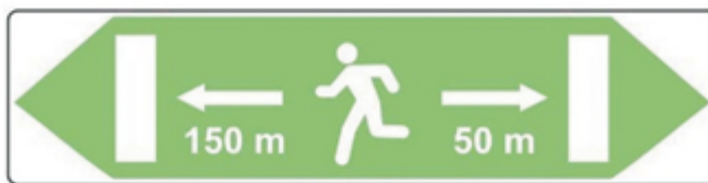
D 71c Úniková cesta

26. V prílohe č.1 II. diele prvej časti Čl. 4 ods. 22 sa na konci pripája táto veta: „Ak ide o tunel dlhší ako 3 000 m, zostávajúca dĺžka tunela sa uvedie každých 1 000 m.“.