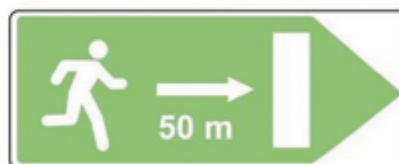
D 71b Úniková cesta