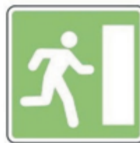
D 70b Núdzový východ