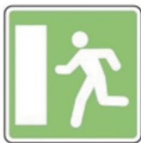
D 70a Núdzový východ