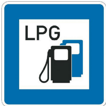
D 22b Čerpacia stanica skvapalneného ropného plynu (LPG)