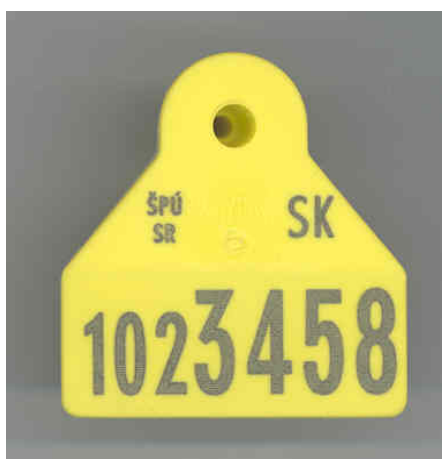
Hranatá ušná značka