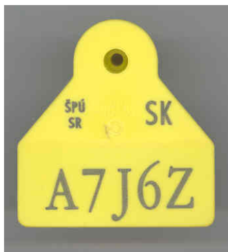
Ušná značka hranatého tvaru