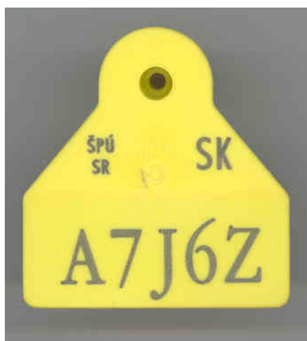
Ušná značka hranatého tvaru