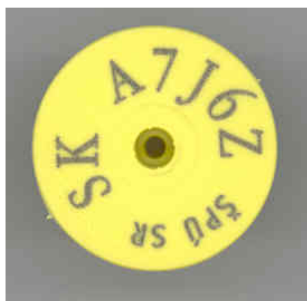
Ušná značka kruhového tvaru