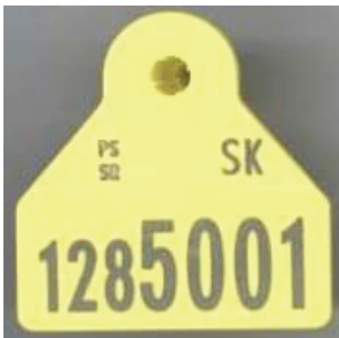
Hranatá ušná značka