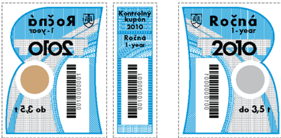
vonkajšia strana nálepky

VZORY TEXTOV NA PAPIEROVEJ PODLOŽKE NÁLEPIEK s ročnou dobou platnosti