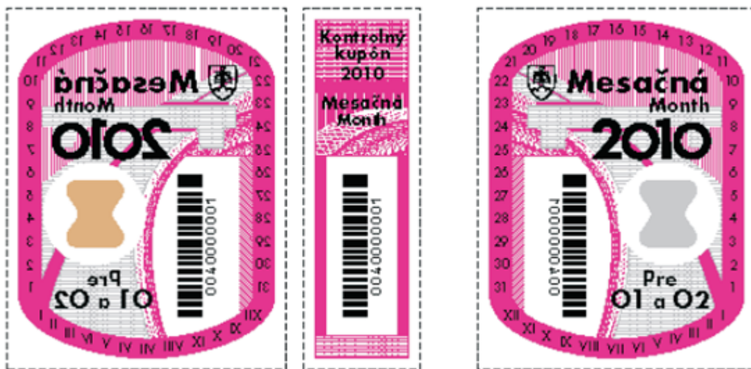
vonkajšia strana nálepky

VZORY TEXTOV NA PAPIEROVEJ PODLOŽKE NÁLEPIEK s mesačnou dobou platnosti pre prípojné vozidlá kategórie O1 a O2