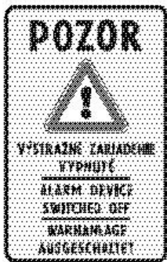
IP 30a Výstražné zariadenie vypnuté

43. V prílohe č. 1 I. diele I. časti bode 5 sa za vyobrazenie dopravnej značky č. IP 30 vkladá vyobrazenie novej dopravnej značky č. IP 30a: