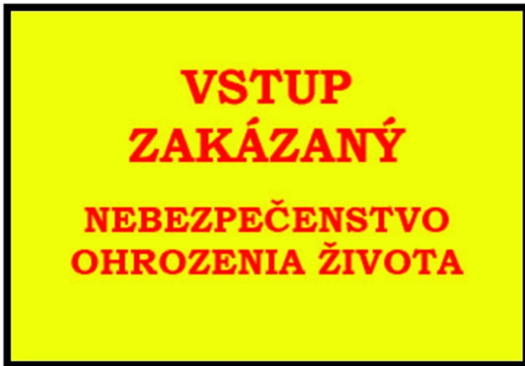
Vzor č. 3