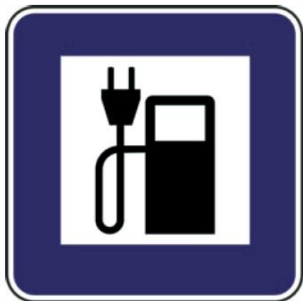
II 8c Nabíjacia stanica