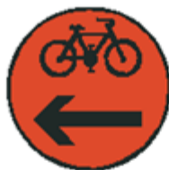
S 7d Signál pre cyklistov s červeným svetlom pre jeden smer so znamením "Stoj!" (vzor)