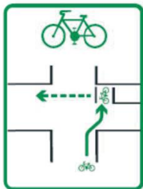
IS 40j Nepriame odbočenie doľava