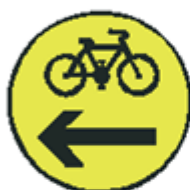
S 7e Signál pre cyklistov so žltým svetlom pre jeden smer so znamením "Pozor!" (vzor)