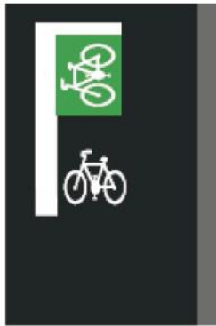
V 8d Nepriame odbočenie doľava