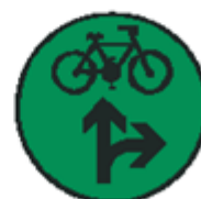
S 7i Signál pre cyklistov so zeleným svetlom pre dva smery so znamením "Voľno" (vzor)