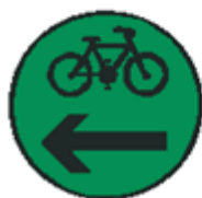
S 7f Signál pre cyklistov so zeleným svetlom pre jeden smer so znamením "Voľno" (vzor)