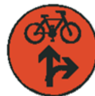
S 7g Signál pre cyklistov s červeným svetlom pre dva smery so znamením "Stoj!" (vzor)