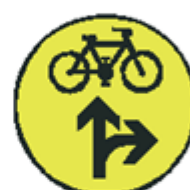
S 7h Signál pre cyklistov so žltým svetlom pre dva smery so znamením "Pozor!" (vzor)