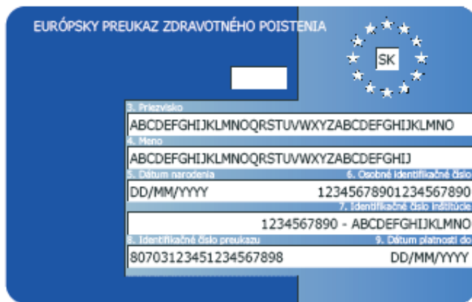
Príklad prednej strany bez čipu