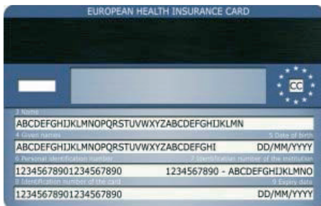
Príklad zadnej strany