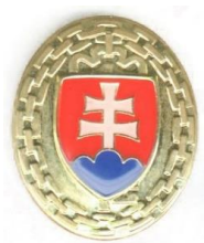
Odznak so štátnym znakom na čiapku