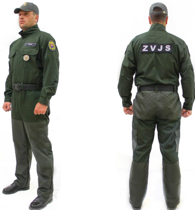
Služobná rovnošata pracovná pre psovoda – taktická vesta