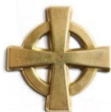
Odznak so štátnym znakom na čiapku