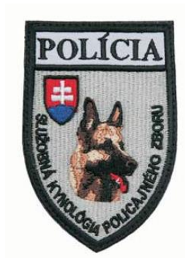
„POLÍCIA“ a „SLUŽOBNÁ KYNOLÓGIA POLICAJNÉHO ZBORU“