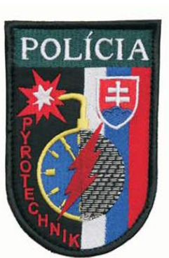
„POLÍCIA“ a „PYROTECHNIK“