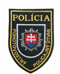
„POLÍCIA“ a „POHOTOVOSTNÝ POLICAJNÝ ÚTVAR“