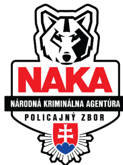
„NÁRODNÁ KRIMINÁLNA AGENTÚRA“ a „POLICAJNÝ ZBOR“