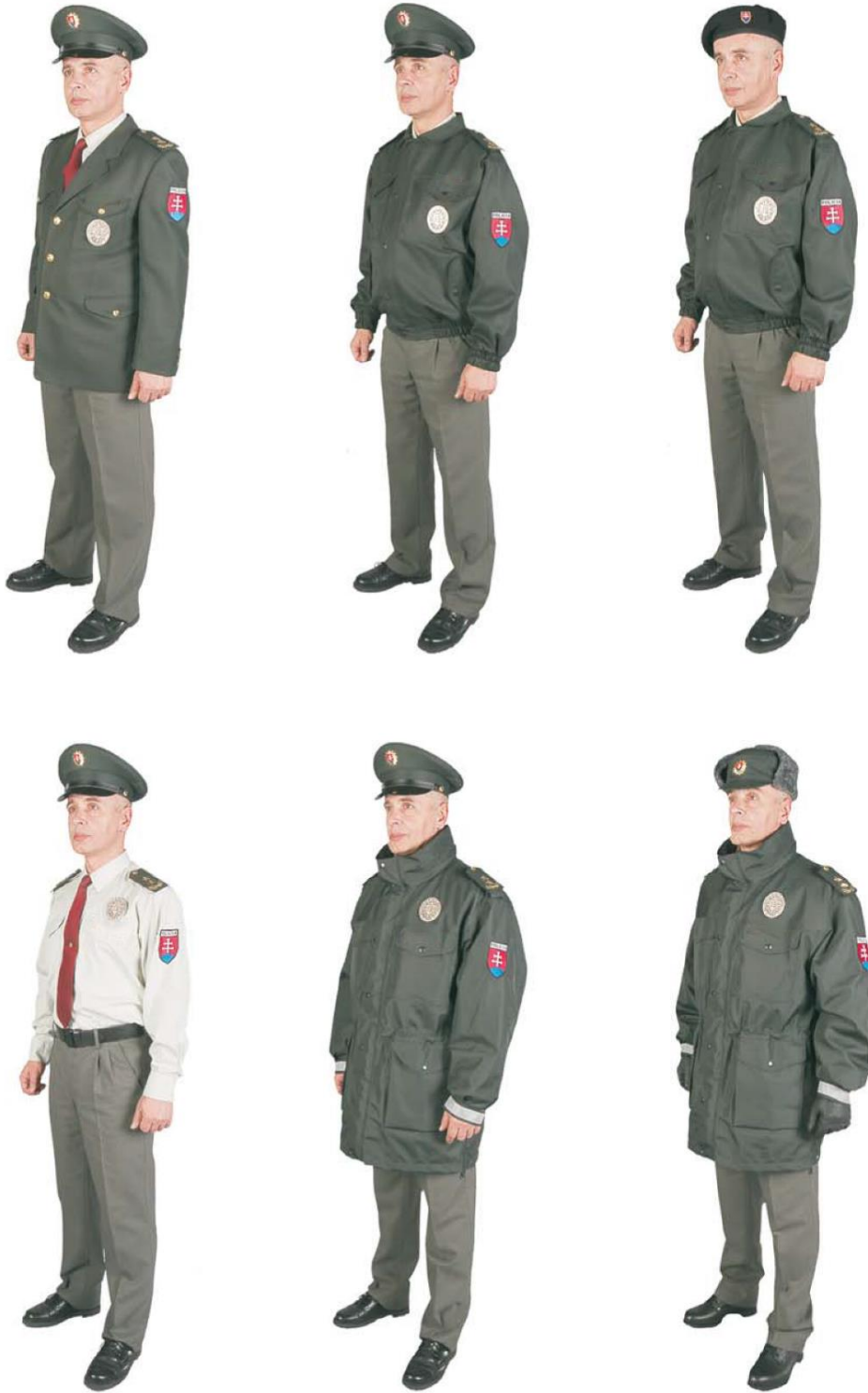
Služobná rovnošata vzor 98 – muž