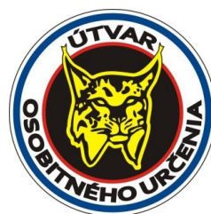
„ÚTVAR OSOBITNÉHO URČENIA“